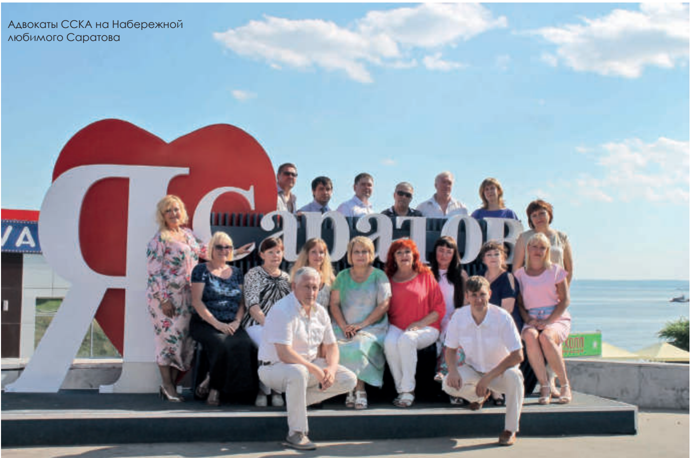
Адвокаты ССКА на Набережной любимого Саратова

Очень сложная ситуация в обществе сложилась в перестроечные годы. Мы обратили внимание, что в исполнительных и законодательных органах практически отсутствуют женщины, а мужчины не будут принимать законы, защищающие жизнь, здоровье и честь женщины. Поэтому в 2002 году в Москве зарегистрировано Общероссийское общественное движение «Женщины во власть». В Саратове было открыто представительство, и я стала главой нашей