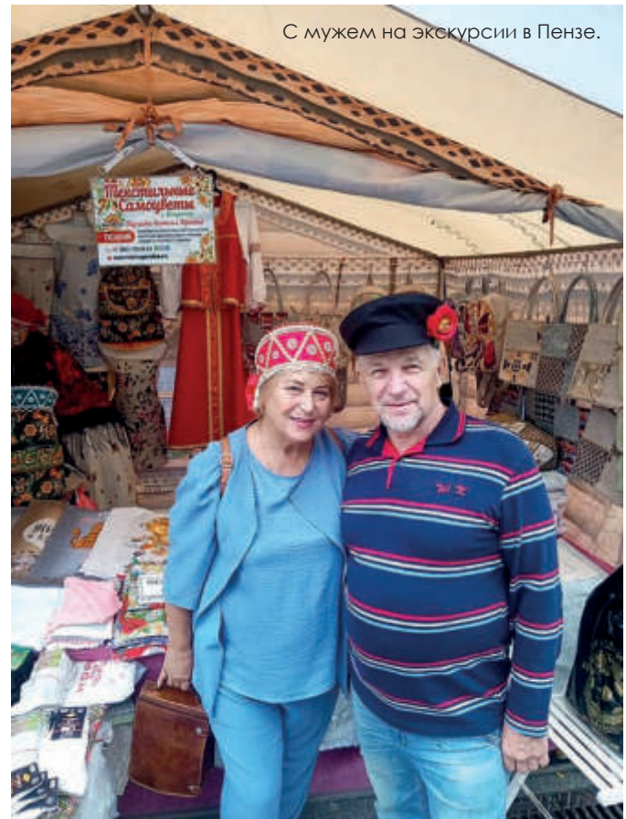
С мужем на экскурсии в Пензе.

– Вы в своих интервью не раз говорили о том, что Вам не импонирует руководитель, который использует авторитарные методы управления. А Вы сами, как руководитель, какие требования предъявляете к себе, какие методы считаете эффективными? Часто ли бываете недовольны собой? Что цените в подчиненных, в коллегах?