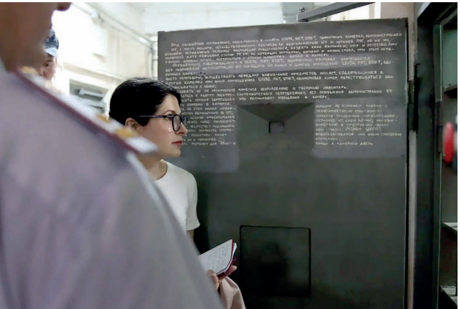
Во время проверки женских колоний в 2022 году

Что касается парикмахера, он есть почти везде. В его роли выступает осужденная из отряда хозобслуги. Услуга эта платная. В женском СИЗО Москвы есть возможность сделать маникюр, привести в порядок брови и т.д. Это тоже платная услуга.