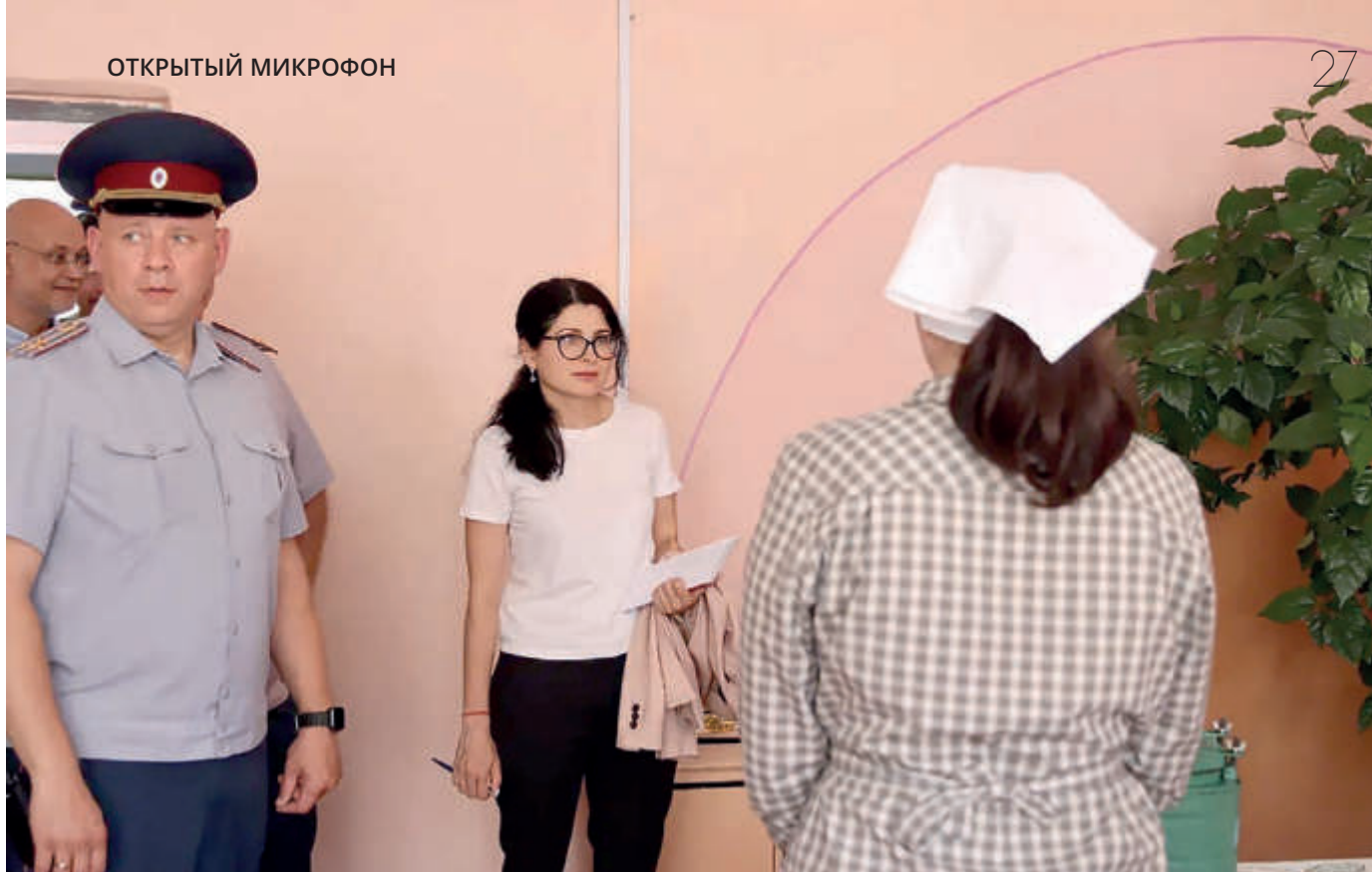
Во время проверки женских колоний в 2022 году

– Топ 5 преступлений – кража, наркотики, мошенничество, растрата, взятка. Я бы выделила три категории преступлений, совершаемых женщинами: