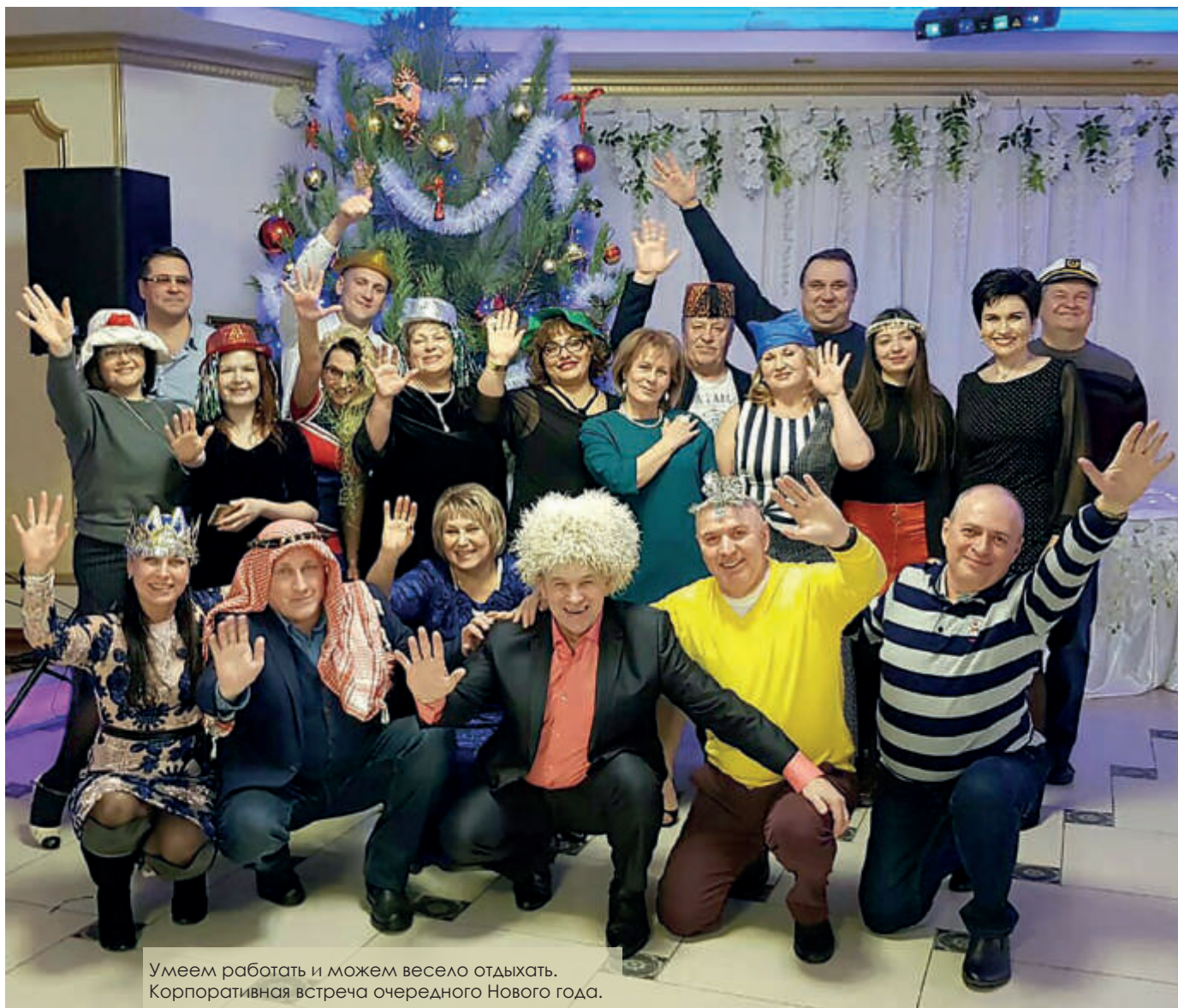
Умеем работать и можем весело отдыхать. Корпоративная встреча очередного Нового года.

– Федор Николаевич Плевако – златоуст русской адвокатуры, мастер уголовной защиты, умевший влиять на присяжных. Я горжусь тем, что в нашей стране «ничто не забыто, и никто не забыт», и фильм про Ф.Н. Плевако – это как бы итог воскрешения памяти о нем. Именно Гильдия начала эту работу: была найдена и реставрирована могила Ф.Н. Плевако. Учреждена Золотая медаль имени Ф.Н. Плевако, церемонию награждения стали проводить в апреле, приурочив к его дню рождения. Всегда приглашались его потомки на наши